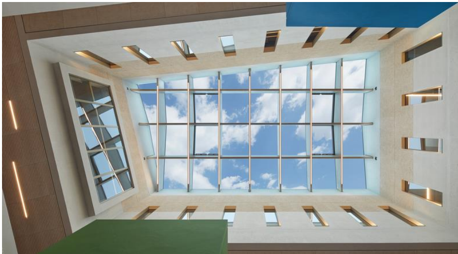
LAMILUX Glasdach PR60 über dem Atrium der Technischen Hochschule Nürnberg

Auch in der Produktkategorie „ Tageslichtsysteme / Dachbelichtung “ überzeugte LAMILUX die Jury und erhielt Silber . Damit würdigten die befragten Architektinnen und Architekten die hohe Qualität, Innovationskraft und architektonische Relevanz der LAMILUX Tageslichtsysteme. Die Auszeichnung unterstreicht die starke Marktposition des Unternehmens als führender Anbieter moderner, energieeffizienter und designorientierter Tageslichtlösungen.