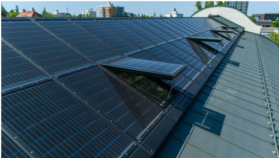
Tageslicht, Brandschutz und Energiegewinnung vereint durch Glasdach PR60

Im Brandfall übernehmen die LAMILUX Lüftungsflügel PR60 zusätzlich die Funktion der Entrauchung – gesteuert über Sensoren und Auslösemechanismen.