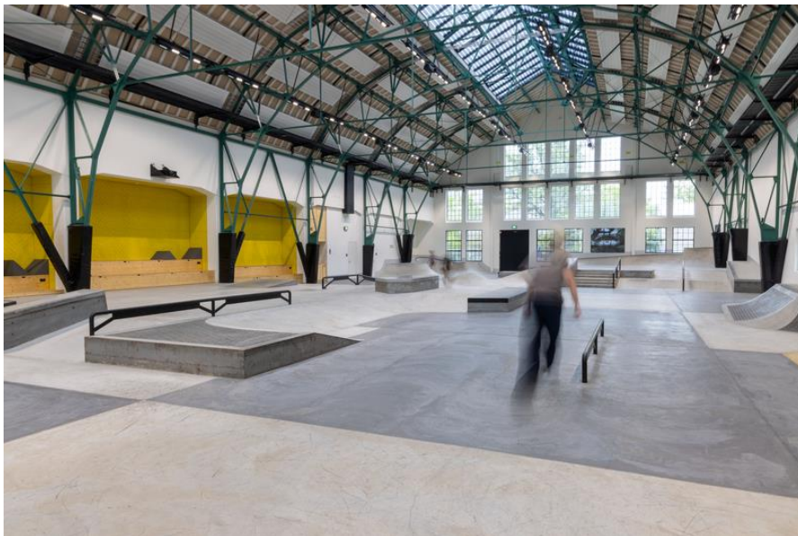
Tageslicht und frische Luft beim Skaten und Biken in der Eggenhalle München

Auch die Nutzer profitieren von der Atmosphäre: „Du hast wahnsinnig viel Platz, du fühlst diesen Raum nach oben und es ist einfach alles super ausgeleuchtet durch das Glasdach“, berichtet Skate-Lehrer Julian Eberle vom Verein High Five.