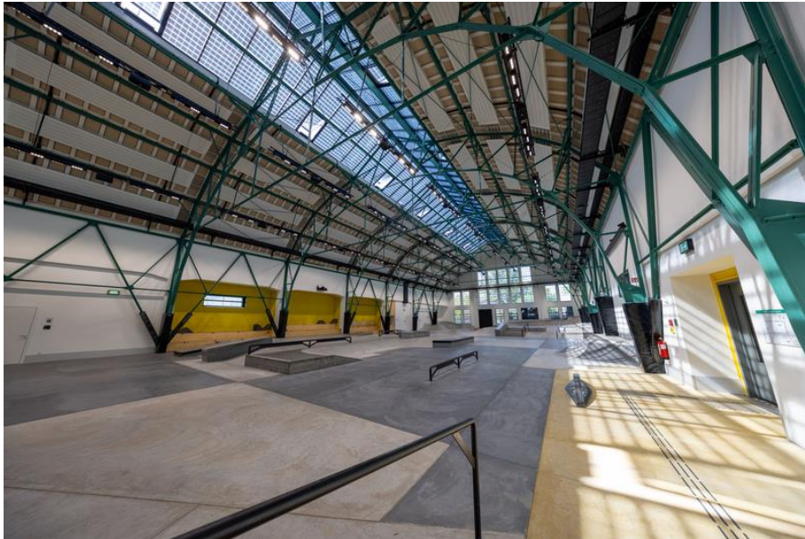
LAMILUX Glasdach PR60 sorgt für natürlichen Tageslichteinfall

Entwicklungspartner auftrat, wurde besonders geschätzt: „Wir fanden es sehr angenehm, dass wir einen Sparringspartner hatten, bei dem man merkt: Die haben auch Lust, etwas Besonderes zu machen.“