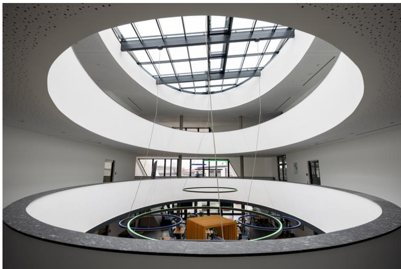
Ansprechende Symmetrie des Atriums dank individueller Dachverglasung