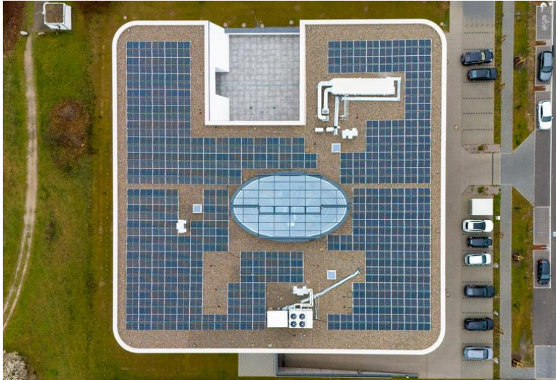
Nachhaltige Flachdachnutzung dank Tageslichtsystemen und Photovoltaik