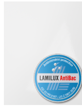
LAMILUX HG 5000 Extra AntiBac