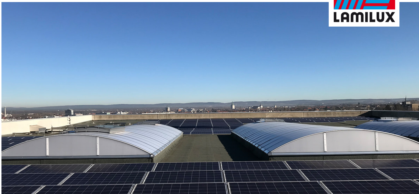
Nahrungsmittelwerk Stute, Paderborn