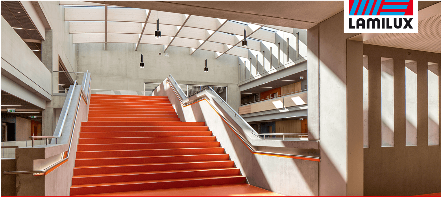
Willibald-Gluck-Gymnasium, Neumarkt i.d. OPf.