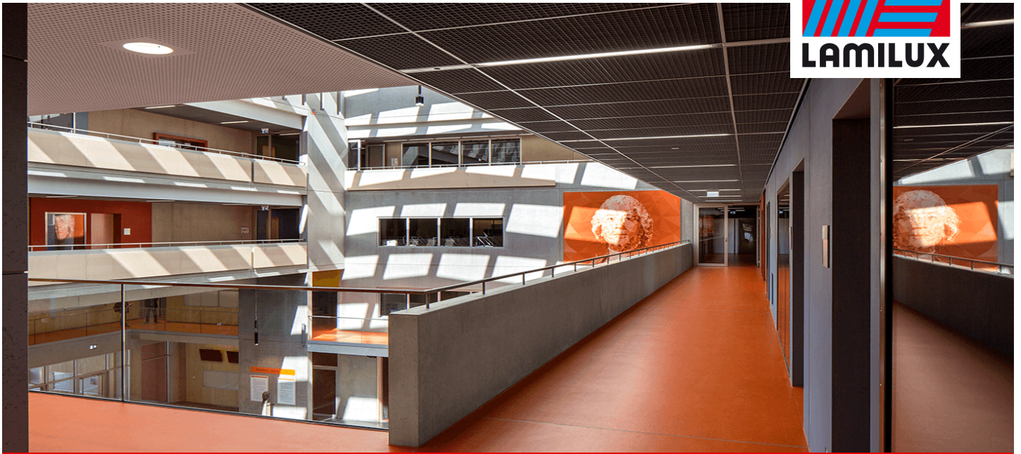
Willibald-Gluck-Gymnasium, Neumarkt i.d. OPf.