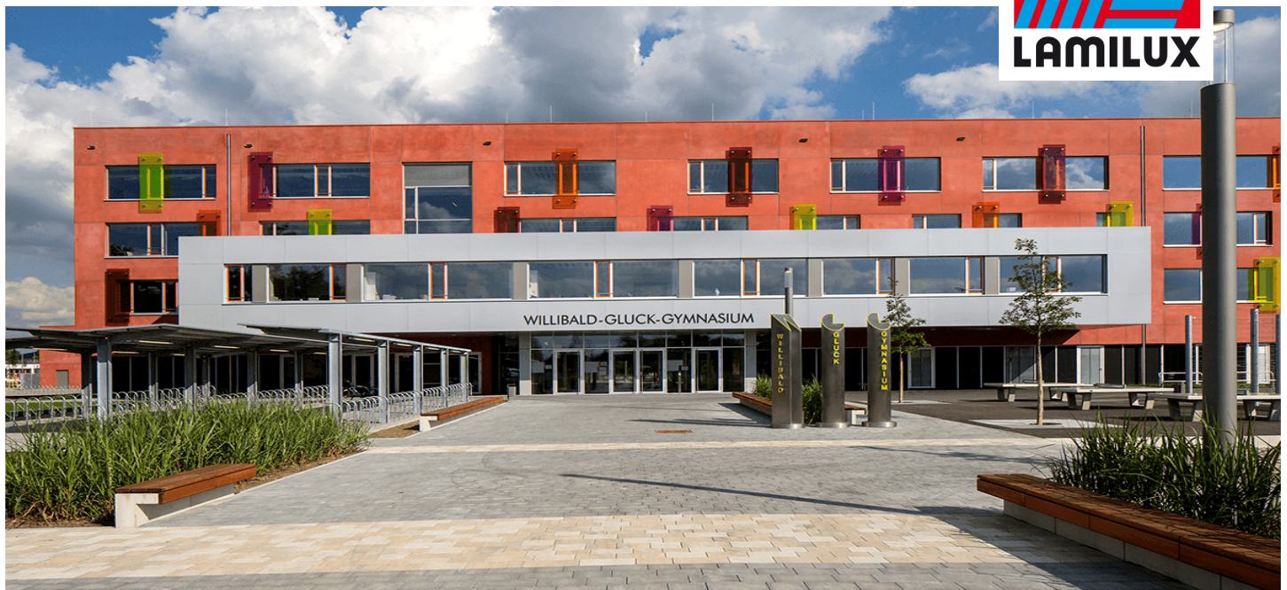
Willibald-Gluck-Gymnasium, Neumarkt i.d. OPf.