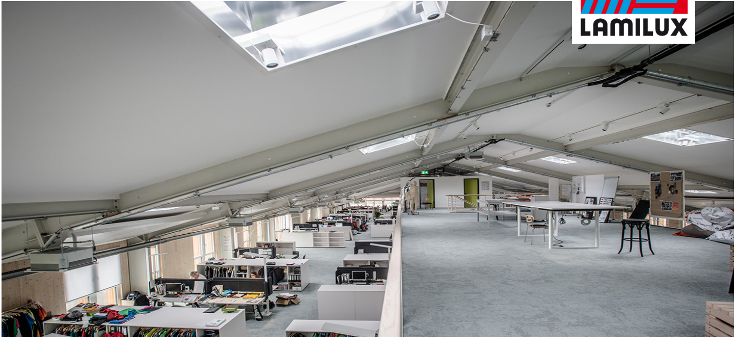
VauDe, Tett nang