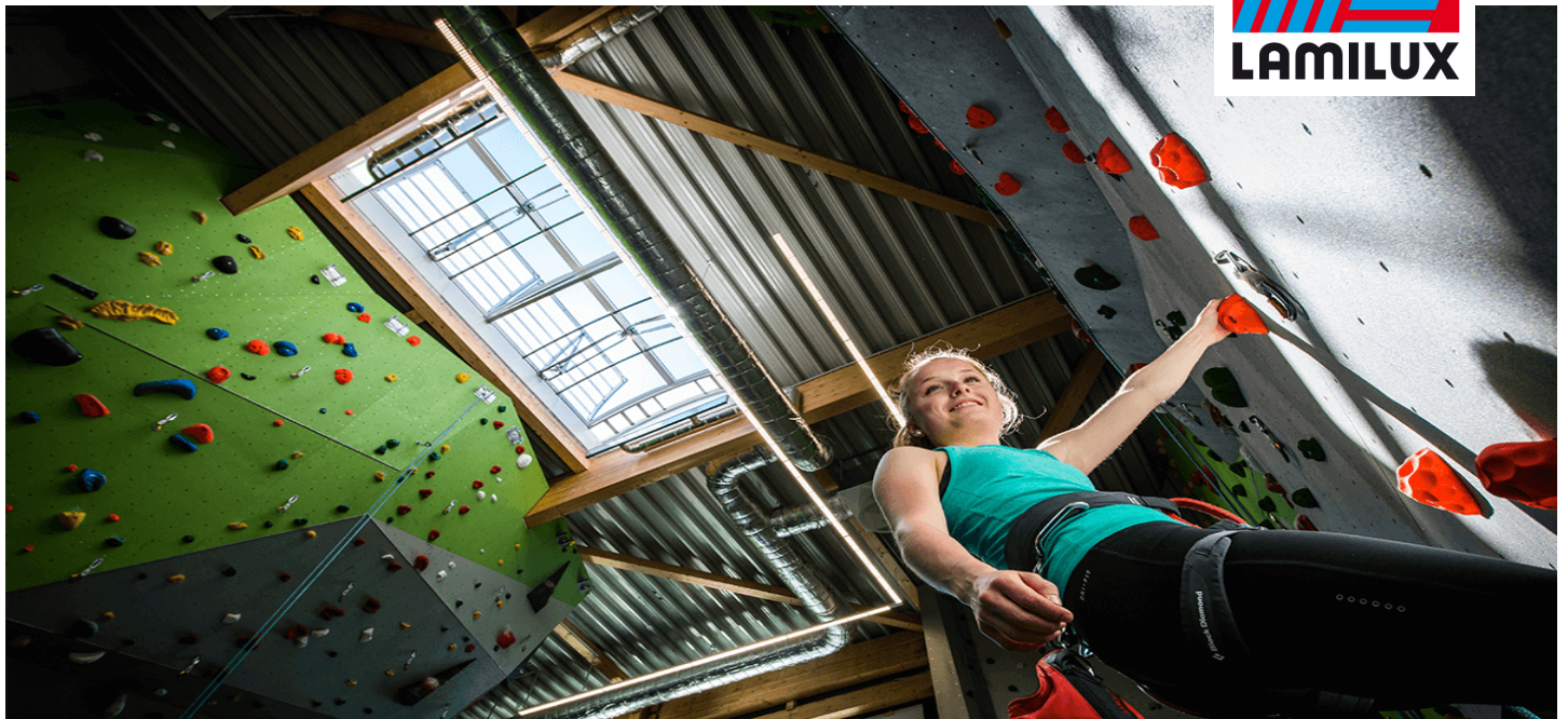
Kletterzentrum OWL, Brakel