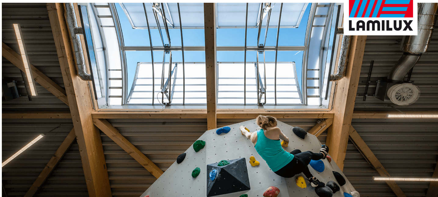
Kletterzentrum OWL, Brakel