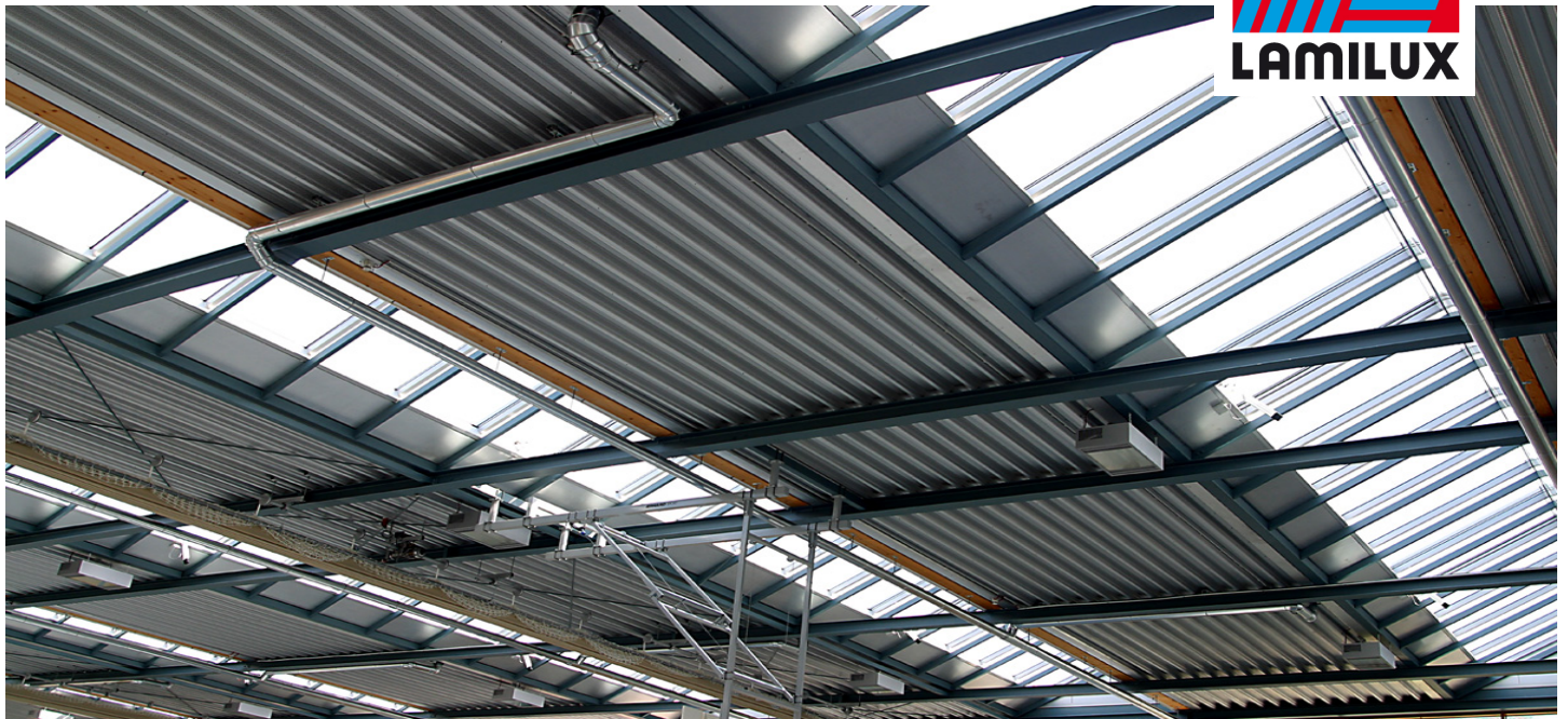
Turnhalle Europäische Schule, Frankfurt