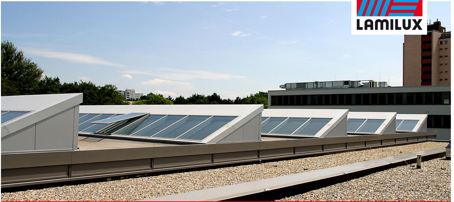
Turnhalle Europäische Schule, Frankfurt