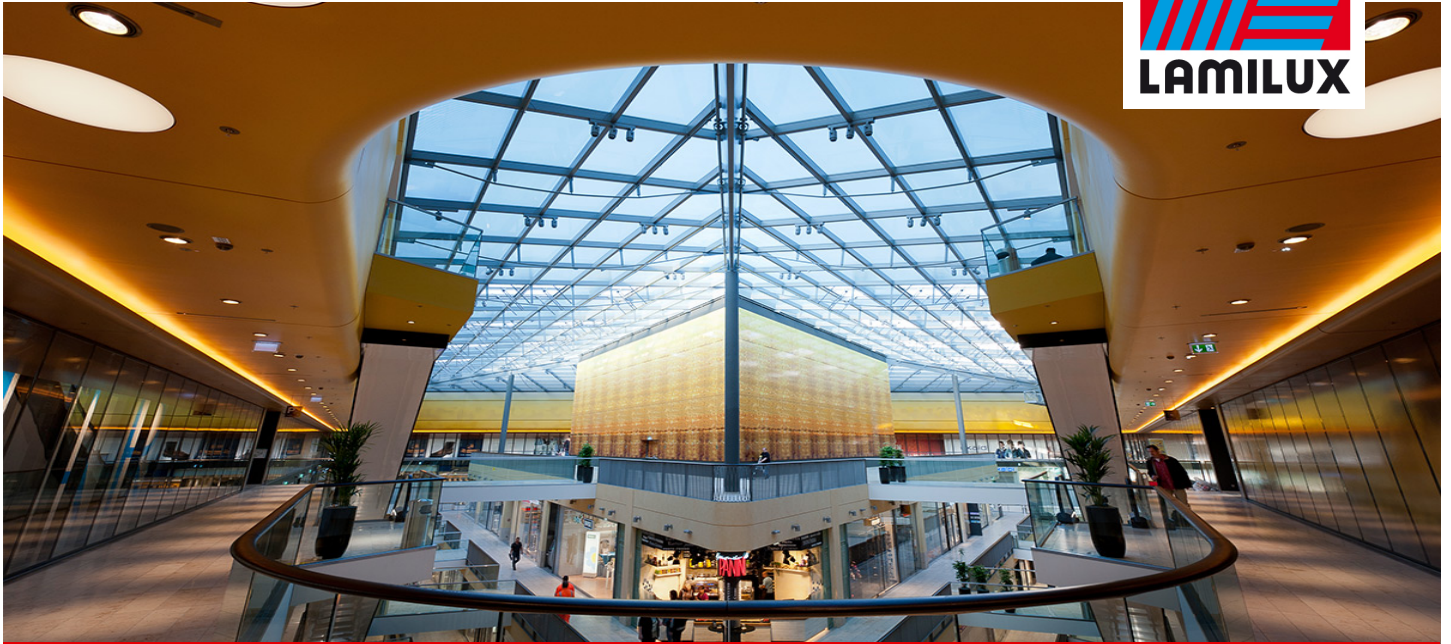
Einkaufcenter Thier-Galerie, Dortmund