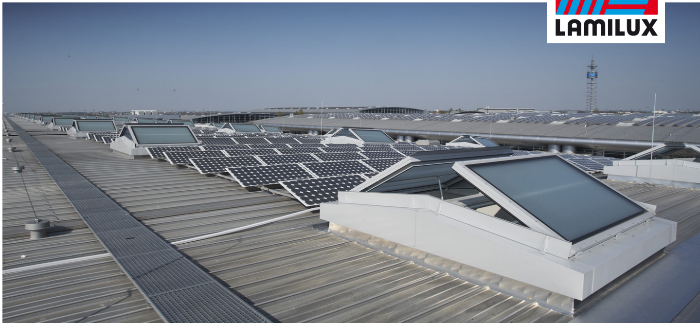
Messe München Messehalle A4, München