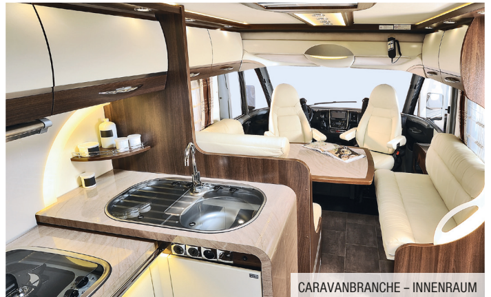
CARAVANBRANCHE - INNENRAUM

Die Angaben in diesem Datenblatt basieren auf unseren derzeitigen Kenntnissen und Erfahrungen. Sie stellen keine Zusicherung von technischen Eigenschaften im Rahmen einer Spezifikation dar. Die Eignung des Produktes für den jeweiligen Anwendungsfall ist auf Grund der vielfältigen Anwendungsparameter vom Verwender selbst zu prüfen. Irrtümer und Änderungen vorbehalten.