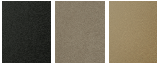
LAMILUX LAMIFOAMTEX Kunstleder