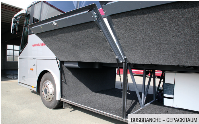
BUSBRANCHE - GEPÄCKRAUM